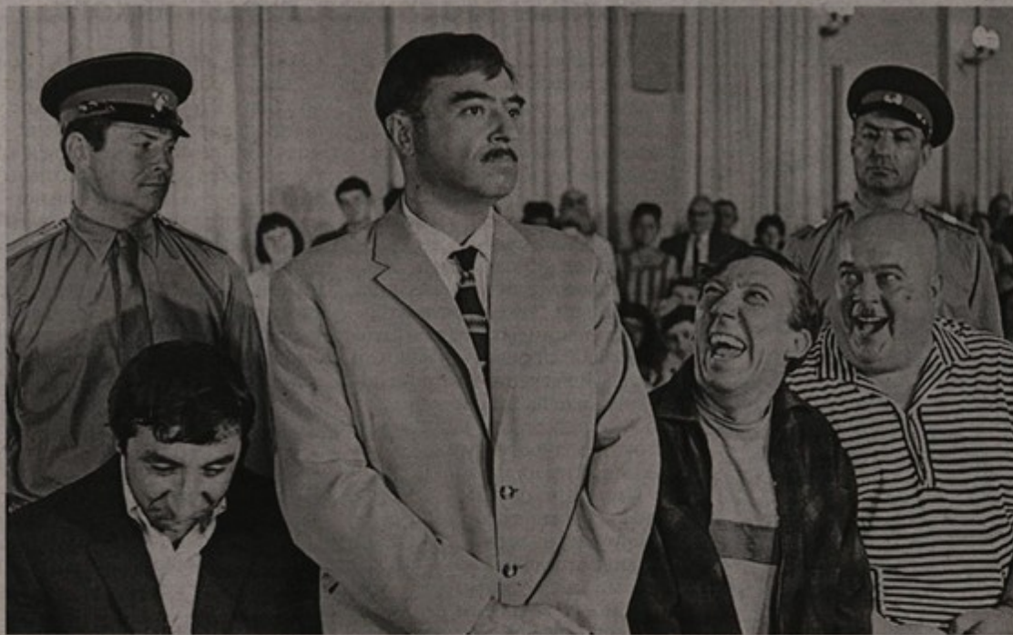
Цена вопроса: 20 баранов, холодильник «Розенлев» и бесплатная путёвка в Сибирь.

Чем ещё кроме денег берут взятки отечественные коррупционеры?