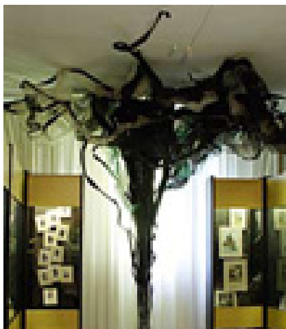
Дерево в зале музея