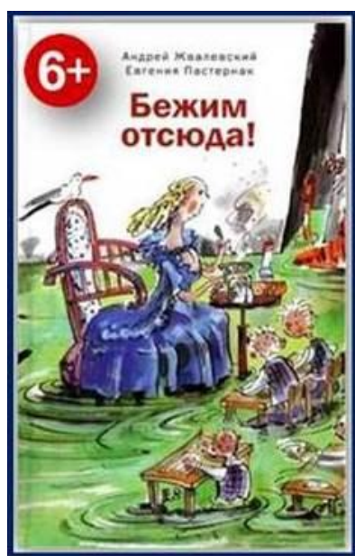
Книга в фонде Центральной библиотеки

Жвалевский, А. В. Бежим отсюда! : повесть-сказка / А. Жвалевский, Е. Пастернак ; художник В. Коротаева. - 2-е изд, стереотип. - Москва : Время, 2015. - 222 с. : рис. — (Время-детство!).