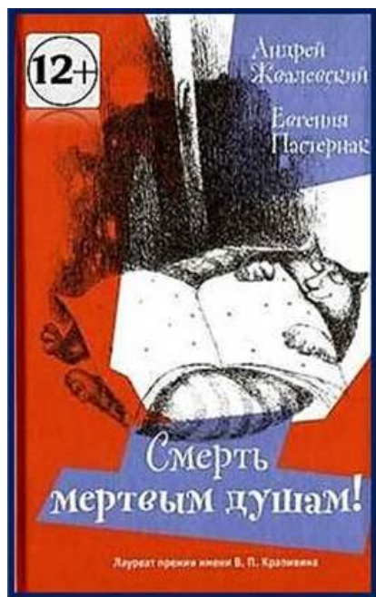
Книга в фонде Центральной библиотеки

Четырнадцатилетнему Славке ещё в раннем детстве поставлен смертельный диагноз. Постоянный приём лекарств, строгий режим, родительский контроль, избегание любых стрессов наполняют жизнь мальчика, иначе он рискует погибнуть. И вдруг в один день он узнаёт, что диагноз был ошибкой. Славка полностью здоров, и перед ним открывается «удивительная перспектива – жизнь». То, что кому-то кажется скучной обыденностью – учёба в школе, занятия в спортивной секции, общение со сверстниками – становятся открытием неизведанного мира, полного тайн, загадок и опасностей. Переживёт ли он такой шок? Какие испытания ждут героя книги в дальнейшей жизни, вы узнаете, прочитав эту книгу.