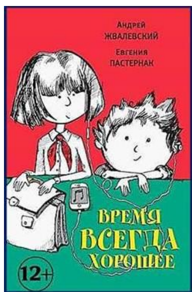
Книга в фонде Центральной библиотеки

1 сентября на праздничной линейке ученики 4 «В» класса обнаружили, а точнее не обнаружили в школе своей любимой учительницы. Грустно? Весело! Представляете, как можно проводить время, когда нет классного руководителя? Можно хихикать, обсуждать друг друга, толкаться и беситься! Но надо учиться. Теперь вести уроки у них будет новый директор – Валерия Кирилловна. Со временем выясняется, что она настоящая ведьма. Бедные дети? Наоборот! Как же им повезло – о таком педагоге можно только мечтать. Нет, она не летает на метле и не варит зелье из летучих мышей, зато может отправить в гости к саблезубым тиграм или к троллям, заколдовать дверь и показать, что творится внутри мобильного телефона. Одним словом, с приходом Валькирии в 4 «В» начали происходить удивительные вещи... волшебные!