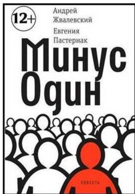
Книга в фонде Библиотеки № 1

Жвалеvский, А. В. Минус один : повесть / А. В. Жвалеvский, Е. Б. Пастернак. - Москва : Время, 2018. - 224 с. — (Время-юность!).